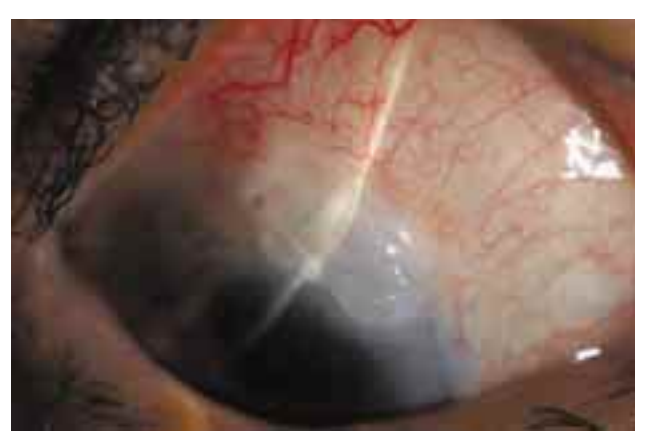
Figure 2, 3 shows anterior avascular, cystic blebs